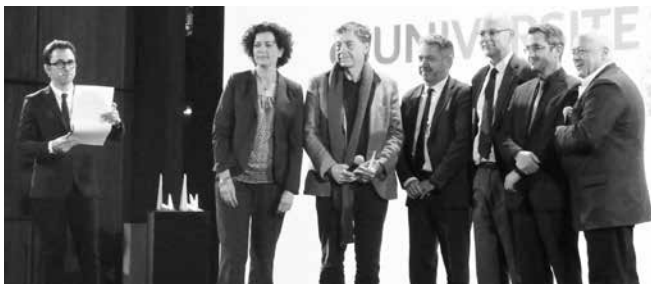
Le CHU de Bordeaux et l'université de Bordeaux, lauréats des Trophées INPI 2014

Le mardi 2 décembre 2014, dans les Serres de l'Orangerie du Parc André Citroën de Paris, s'est déroulée la remise des prix des Trophées 2014. Le CHU de Bordeaux et l'université de Bordeaux ont été désignés lauréats des Trophées INPI 2014 dans la catégorie « Recherche », en récompense du travail réalisé par l'équipe de recherche qui a su reconnaître l'effet du propranolol dans une nouvelle indication et a eu la volonté de passer de l'observation au développement d'un médicament accessible aux patients, dans des conditions de sécurité maximale.